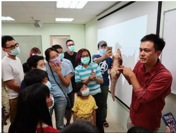
里山系列講座-穿山甲介紹