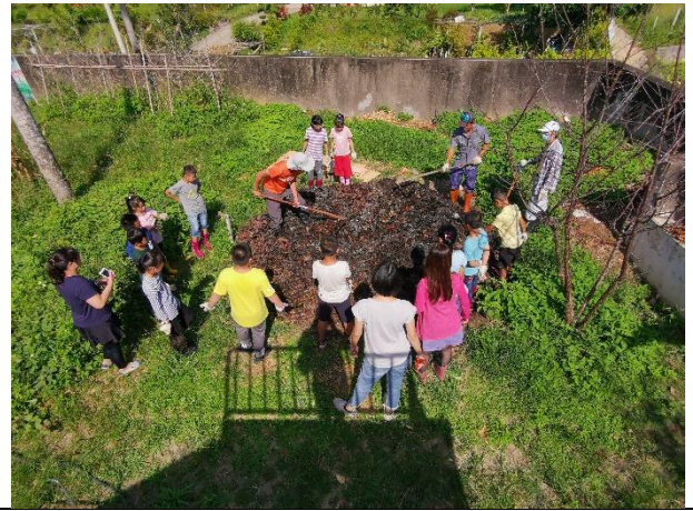
沙坑國小環教課程—推肥製作