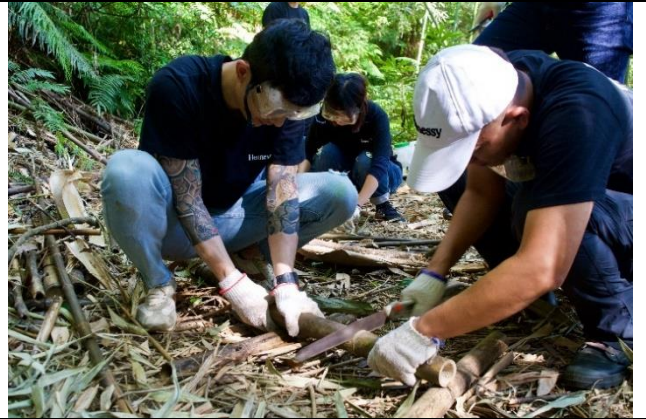
11/7 例行棲地維護志工