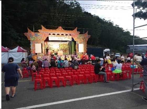
11/21 客家傳統戲曲收冬戲