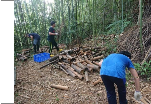
9/27 寶悍運動平台工作假期