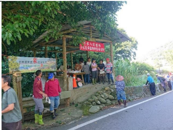
9/22 小花蔓澤蘭清除活動