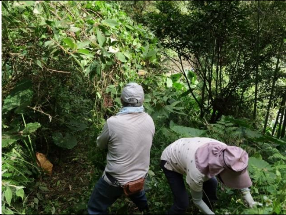
12/5 例行棲地維護志工