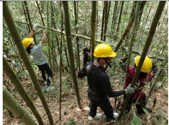
7/25 自然谷自辦工作假期