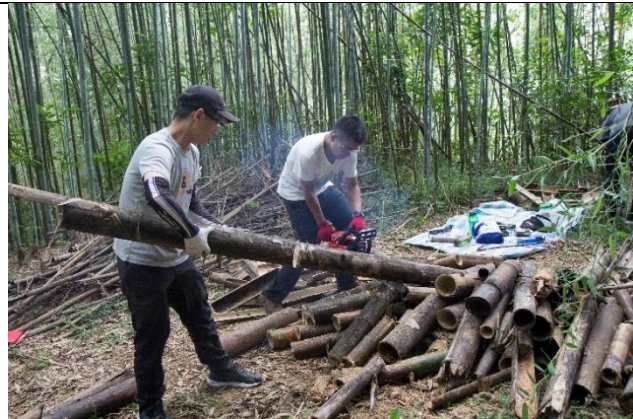
7/4 例行棲地維護志工