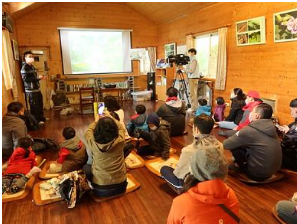
假日免費導覽—室內自然谷及環境信託介紹