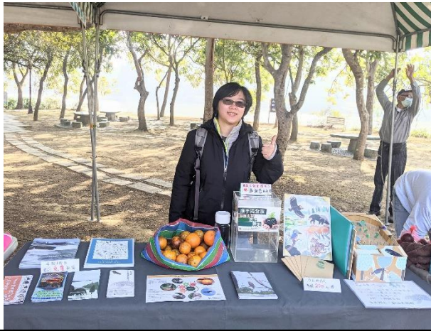
擺攤—清大綠市集擺攤活動