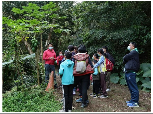
假日免費導覽—室外生態導覽