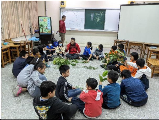
碧潭國小環教課程—認識植物