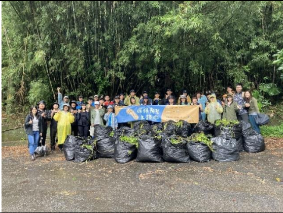
10/17 例行棲地維護志工