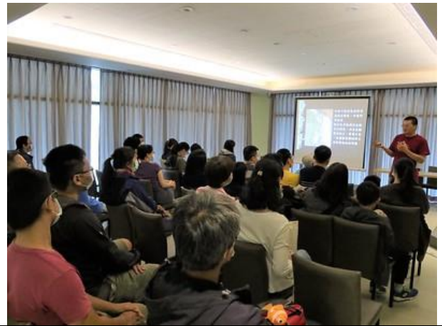
里山系列講座-貓頭鷹巢箱設計與運用