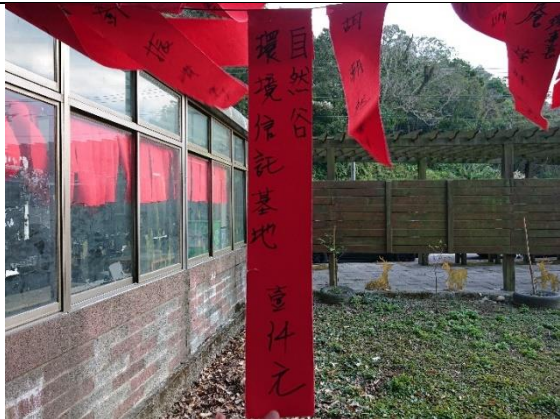
2/1 華龍村社區長青會會員大會