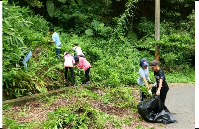
10/15 酪悅軒尼詩工作假期