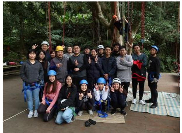
預約參訪—南門扶輪社青年團參訪活動