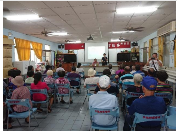
8/1 華龍村社區長青會定期會