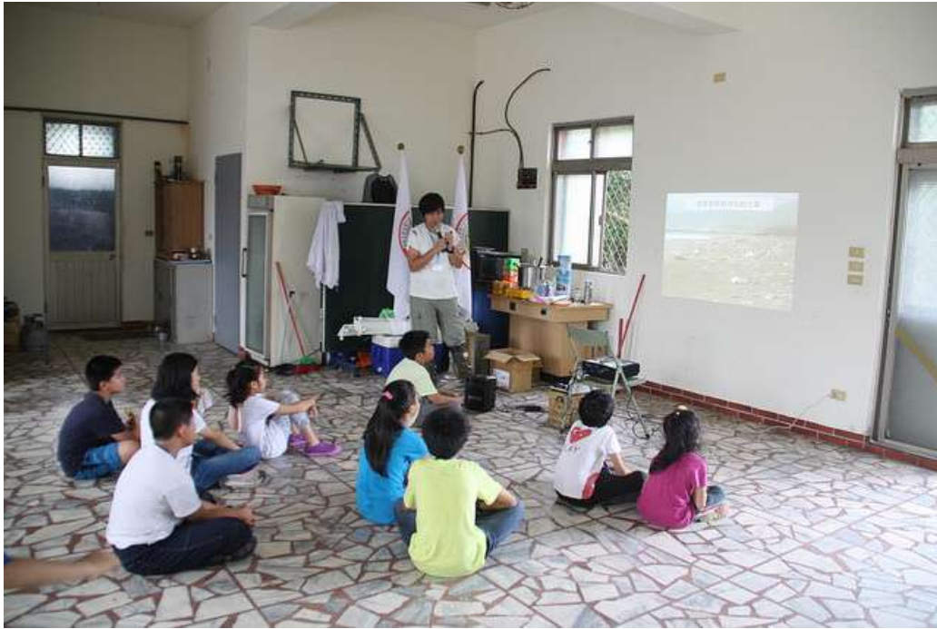
海洋廢棄物議題分享