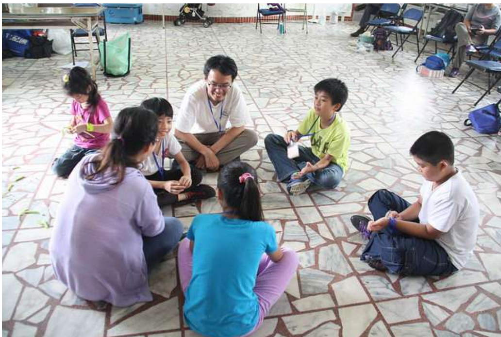
逐格動畫故事情節發想