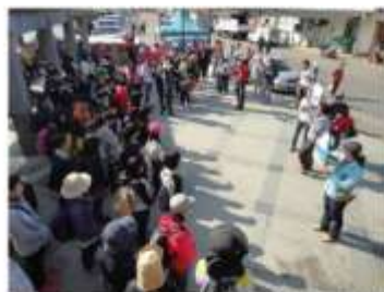
集合、安全說明、器材發放