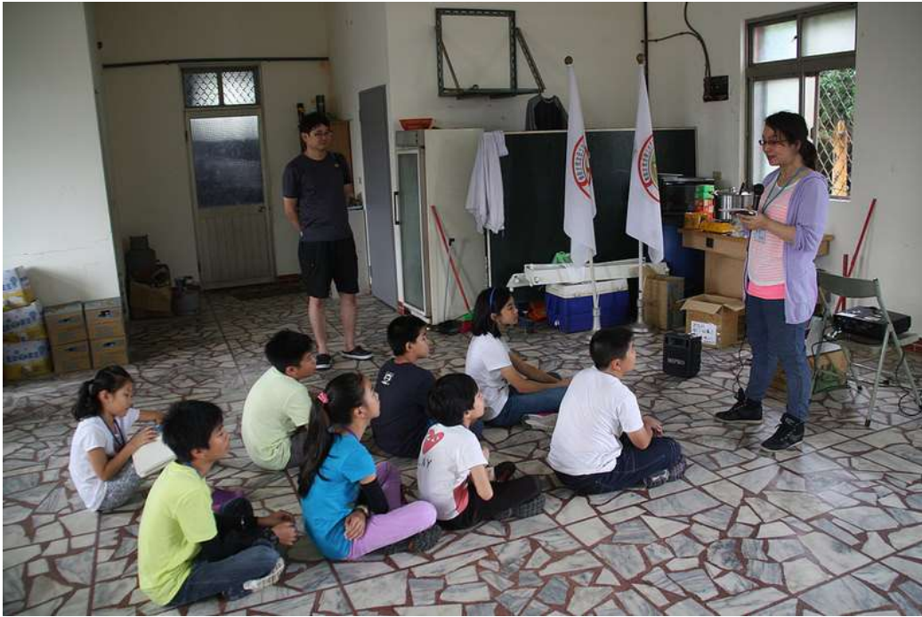
講師說明素材蒐集注意事項