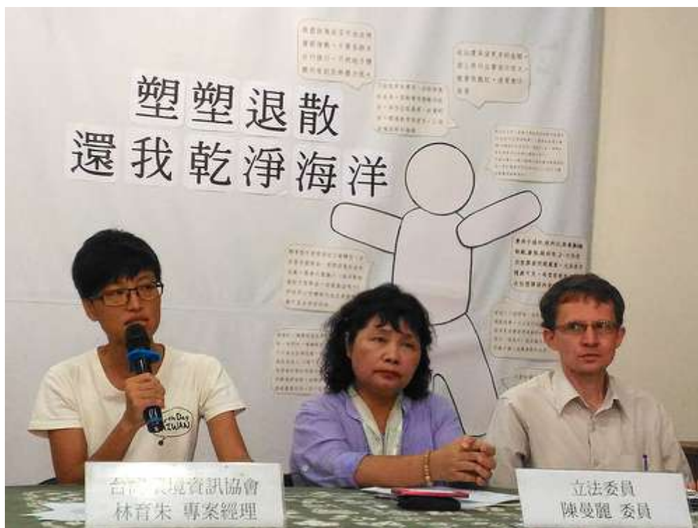
塑塑退散，還我乾淨海洋記者會

管制範圍及提升塑膠袋費用外，內用店家或攤販不提供任何材質免洗餐具及鼓勵商家提供外帶客人自備容器優惠。